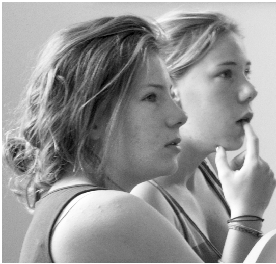
Az ámulat pillanatai

Másnap reggel közös dicsőítéssel kezdtük a lelki programot. Ez követően nagytiszteletű úr a II. Helvét Hitvallás alapján beszélt,