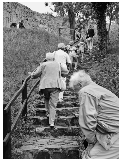
Nemcsak igével él az ember