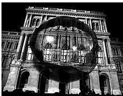
Az MTA székházának homlokzata a tavalyi virtuális épületfestő versenyen