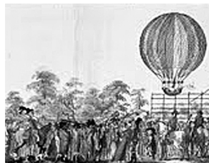
Kép a kiállítás anyagából egy 1791. május 29-én lezajlott bécsi eseményről

Kivételesen izgalmas kiállítás tekinthetnek meg január 20-ig az érdeklődők Az Ország Tükre – A képes