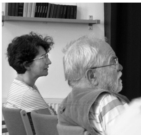
Az összpontosítás pillanatai

luk valószínűleg már nem olyan érdekes. A hétvége lelki programjának fő témája az egyház mi- benléte volt.