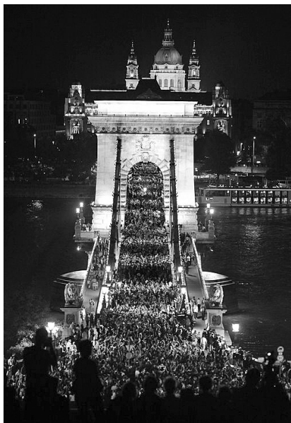
Az élő híd

Ezen jelen voltak a protestáns és ortodox egyházak, illetve az iszlám, a zsidó, a buddhista, a hindu és a dzsainista vallás képviselői is. A protestánsok a fásori evangélikus templomban vettek részt úrvacsorás istentiszteleten. A Genfestet először 1973-ban rendezték meg Firenze mellett, majd többnyire más olaszországi helyszíneken. A budapesti volt az első alkalom, hogy a kelet-közép-európai régió adott otthont a világtalálkozóknak. A legutóbbi Genfestet 2000-ben tartották ( www.genfest.org )